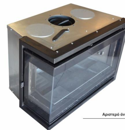
Αριστερό άνοιγμα (SX)