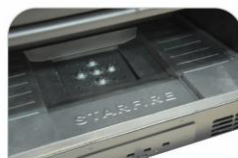
Εξ' ολοκλήρου μαντεμίνος θαλάμος καύσης