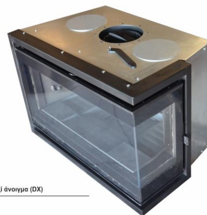
Δεξί άνοιγμα (DX)