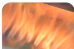
Δευτερεύουσα οικολογική καύση