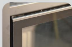
Πόρτα εξ' ολοκλήρου από κεραμικό γυαλί (Crystal)