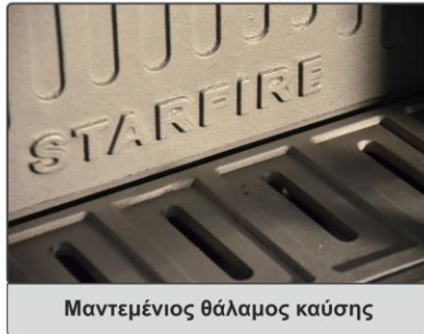
Μαντεμένιος θάλαμος καύσης