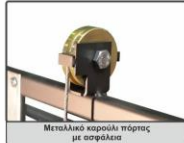
Μεταλλικό χερούλι πόρτας με ασφάλεια