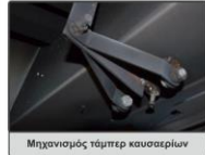
Μηχανισμός τάμπερ καυσαερίων