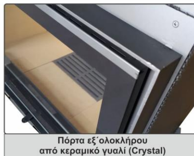
Πόρτα εξ' ολοκλήρου από κεραμικό γυαλί (Crystal)