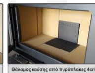
Θάλαμος καύσης από πυρόπλακες 4cm