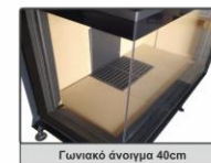
Γωνιακό άνοιγμα 40cm