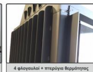
4 φλογαυλοί + πτερώγια θερμότητας