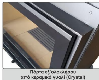
Πόρτα εξ'ολοκλήρου από κεραμικό γυαλί (Crystal)