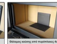
Θάλαμος καύσης από πυρόπλακες 4cm