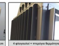
4 φλογαυλοί + πτερύγια θερμότητας