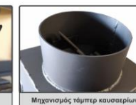
Μηχανισμός τάμπερ καυσαερίων